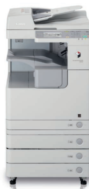
Модель imageRUNNER 2530i с дополнительными кассетами для бумаги и дуплексным автоподатчиком оригиналов