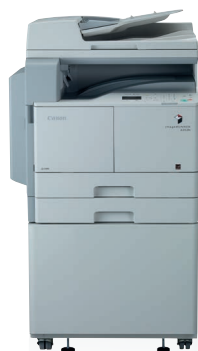
Модель imageRUNNER 2202N с дополнительным автоподатчиком документов, кассетой и подставкой

Мы понимаем, что несмотря на то что все виды бизнеса сталкиваются с одинаковыми проблемами, каждый бизнес все же уникален в своем роде. Именно поэтому линейка компактных устройств Canon imageRUNNER предоставляет широкий спектр модульных многофункциональных устройств для работы с форматами А4 и А3, позволяющих найти решение, соответствующее вашим требованиям.